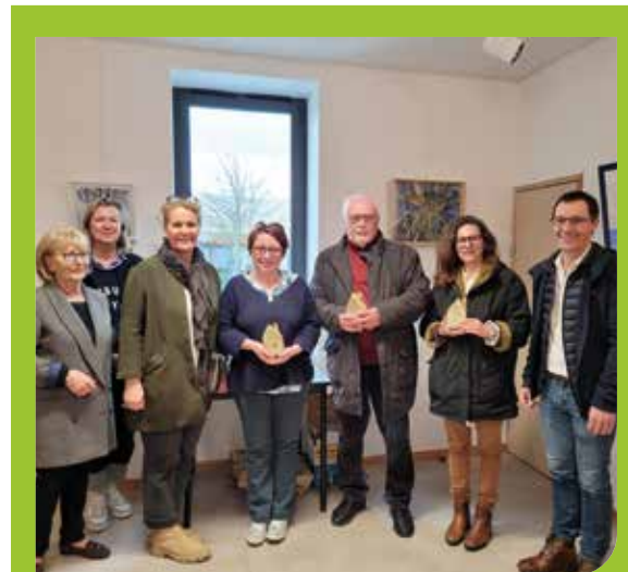
>Les lauréats du 1 er salon des artistes amateurs entourés des élus.

📞 www.mediatheque.bretignolles-sur-mer.fr – 02 51 90 18 26