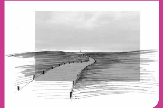
>Etat projeté rue des Taillées.

Bon à savoir : Les délais de réalisation de ces travaux ont été allongés par rapport aux dates annoncées lors de la réunion publique le 22 septembre 2022 parce que dans les dunes de la Sauzaie, un bon nombre de parcelles appartiennent à des propriétaires privés. L'ajustement du tracé de la voie a donc nécessité de longues procédures foncières.