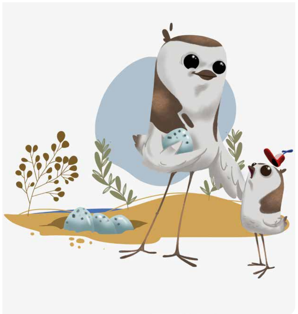
>Hugo le gravelot est le nouvel ambassadeur de l'environnement à Brétignolles-sur-Mer. Suivez ses aventures !