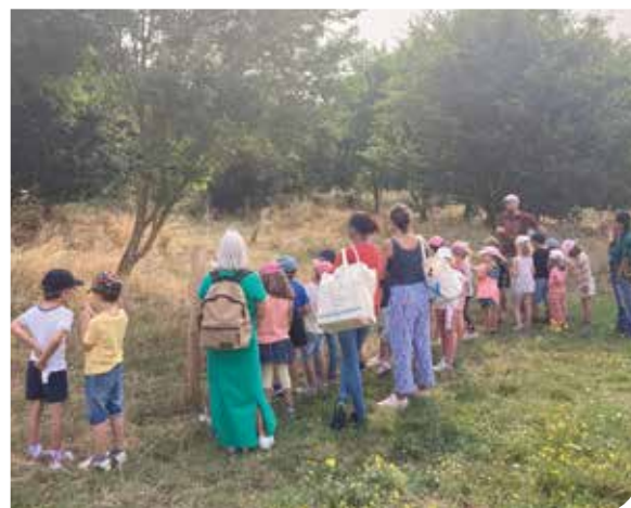
>L'éleveur a expliqué aux enfants le rôle des animaux dans l'entretien des sols.