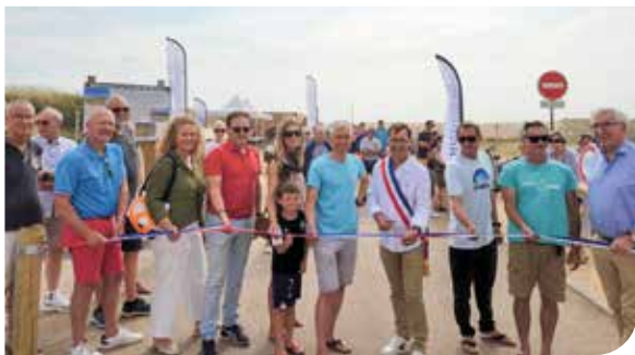
>L'inauguration du nouvel aménagement a eu lieu le 17 juin 2023.

Cet été, vous avez pu découvrir un nouvel accès à la plage de Dunes 1. L'enjeu était de rendre ce site plus adapté et moderne pour les activités tout en étant mieux intégré à l'espace naturel dunaire où l'aménagement par la commune est toléré, sans artificialisation pérenne, par l'Office national des forêts, propriétaire des lieux. La Ville a investi près d'un million d'euros afin de moderniser les structures d'accueil des activités de sports nautiques et du point de restauration proposé sur place, de faciliter