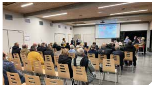
>Les dernières réunions de quartiers ont eu lieu en novembre 2021.