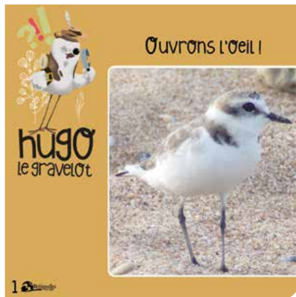
>Premier rendez-vous avec Hugo sur les réseaux sociaux.

La sensibilisation aux sujets environnementaux est un des axes majeurs de la politique menée par la Ville. Dans la continuité des actions menées en ce sens, les élus municipaux souhaitent faire la part belle à la découverte et à la connaissance de la biodiversité ordinaire ou protégée qui se trouve autour de nous. De cette volonté est née une mascotte vouée à être l'ambassadeur de l'environnement dans notre commune. Elle a pour