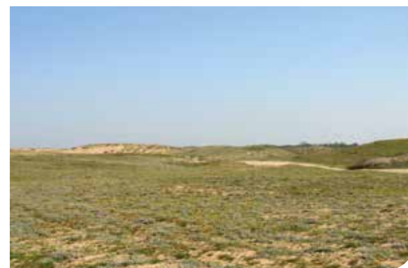
>Les massifs dunaires.

À l'inverse, l'arbre a parfois été historiquement planté dans les dunes pour créer des zones d'ombre et de brise-vent aux abords des anciennes constructions. Toutefois, dans ces espaces, l'espérance de vie des arbres est réduite car ils ne sont pas adaptés aux embruns et au sol pauvre et sec. Pire même, ils nuisent au développement de la végétation dunaise. C'est pourquoi, depuis quelques années, le Conservatoire du Littoral procède à des coupes de pins ou cyprès dans des espaces dunaires afin de restaurer la dune grise, véritable réservoir de biodiversité dunaise. Cette action devrait se poursuivre cet automne et durant l'hiver avec l'abattage des cyprès inadaptés sur les parcelles situées rue de la plage du Jaunay. Une initiative nécessaire pour préserver la flore caractéristique de ce site naturel protégé. De la même manière, dans certains anciens lotissements de la ville, des mûriers platanes font également l'objet d'abattages car leurs racines envahissantes occasionnent des dégâts (voirie, clôtures...). Systématiquement, un arbre abattu est remplacé par un autre, ou au mieux deux arbres d'essence locale plus adaptés à notre climat et aux aménagements du territoire.