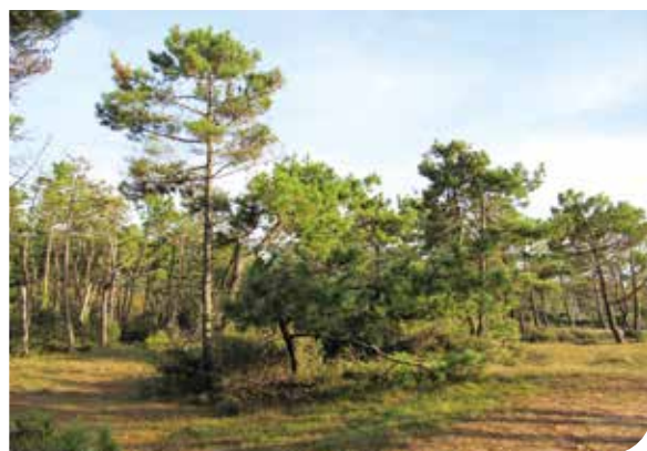
>Notre patrimoine arboré.

Dans un contexte d'adaptation au réchauffement climatique, la renaturation et la plantation d'arbres en ville est un sujet d'actualité pour de nombreuses collectivités. Mais déjà depuis plusieurs années, la végétalisation du cœur de ville a été identifiée comme primordiale à Brétignolles-sur-Mer. Elle est devenue un élément identitaire de notre commune. Forte de ses 3 700 arbres urbains, la Ville pérennise et valorise ce paysage via un plan de gestion de l'arbre. Objectifs : augmenter la biodiversité, transmettre cet héritage aux générations futures et faire profiter la population des bienfaits de l'arbre (régulation de la température et de l'hygrométrie, dépollution, bien-être sur la santé...). Des bienfaits que l'on retrouve donc lorsque le thermomètre grimpe. Même si notre commune est moins touchée que les métropoles par l'effet d'îlot de chaleur