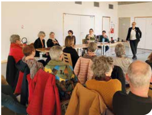
>Assemblée générale extraordinaire de l'association au printemps 2023.

L'association Histoire de Lire , qui a assuré le bon fonctionnement et l'animation de la médiathèque de Brétignolles-sur-Mer pendant plus de 10 ans, a tiré sa révérence. La Municipalité a alors choisi de reprendre le flambeau et a remercié chaleureusement l'association d'avoir proposé, avec ses nombreux bénévoles, une offre culturelle si riche et diversifiée. En reprenant ce pilotage, la commune s'est engagée à poursuivre cette action.