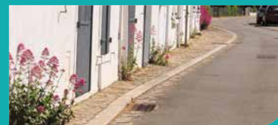
>Nous ne sommes pas des mauvaises herbes !

Le centre-bourg (code 1) est entretenu tous les jours avec une tonte très régulière, des plantations de fleurs ornementales, de vivaces locales et leur pousse est maîtrisée par un désherbage manuel sélectif. A l'inverse, des espaces verts plus fonctionnels comme ceux des lotissements sont gérés selon le code 3. La tonte est pratiquée moins souvent, le désherbage des massifs est ponctuel et ceux-ci sont composés uniquement de plantes locales sauvages.