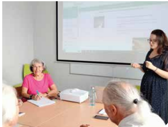
> Les nouveaux ateliers numériques, un plus dans l'offre de la médiathèque.

Plus d'infos et inscriptions : 02 51 55 55 55.