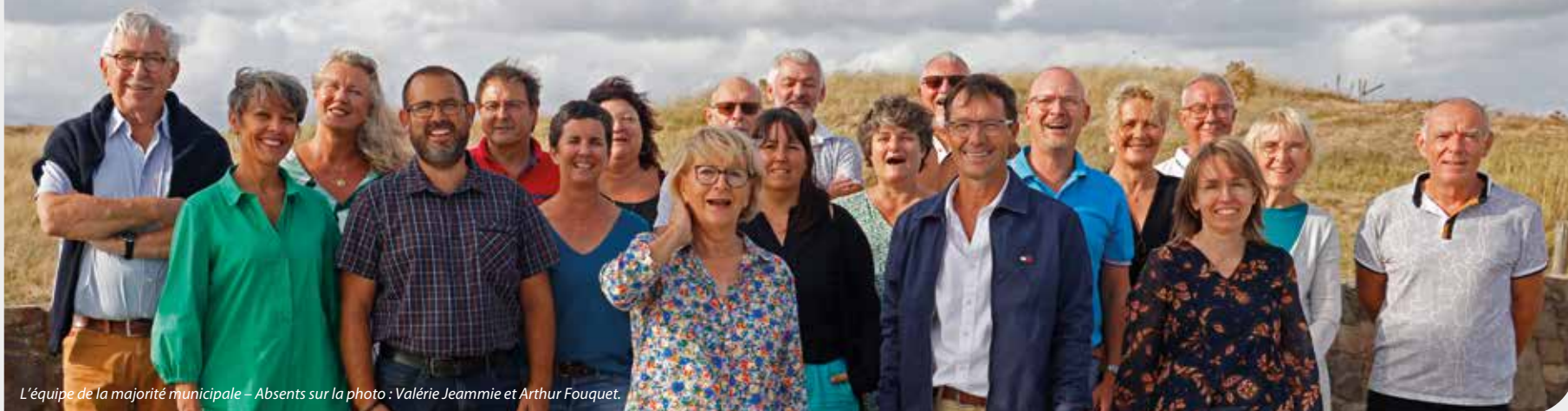
L'équipe de la majorité municipale – Absents sur la photo : Valérie Jeammie et Arthur Fouquet.