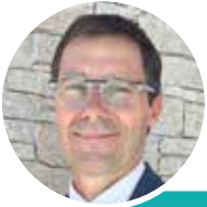
Frédéric FOUQUET, Maire de Brétignolles-sur-Mer