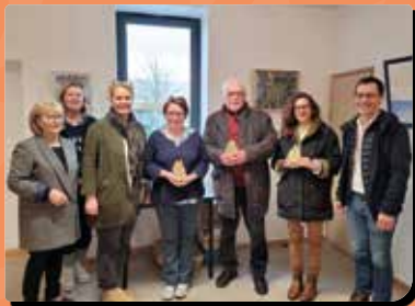
Les lauréats du SAA 2023 avec des élus municipaux.

Après le succès de la première édition tant par le nombre de visiteurs (plus de 600 dans le weekend !) que par la variété des œuvres (46 artistes), le salon des artistes amateurs est de retour pour mettre en lumière la pratique artistique amateur à la Maison des Frères.